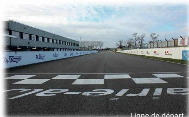
Ligne de départ

PROGRAMME 2018 « TERRITOIRES INTELLIGENTS »